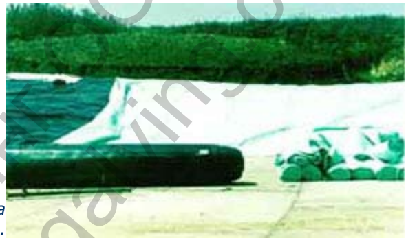
Полагане на противопробивен слой за защита на геомембрана.

За разделяне – когато се изисква разделно полагане на различни фракции, като разделител на земен грунд и следващи строителни фракции.