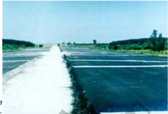
ГЕОТЕКСТИЛ® , използван като разделител на земен грунд..

мостови основи. Подходящи са за почвени райони с повишена влажност и ниска носеща способност.